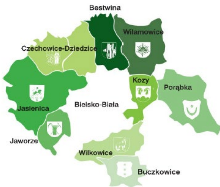
Rysunek 1 Zarys gmin należących do LGD Ziemia Bielska.